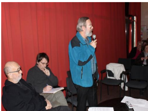
Une partie du bureau en action

ORGNAC, CITE DE LA PREHISTOIRE 4 FÉVRIER 2017