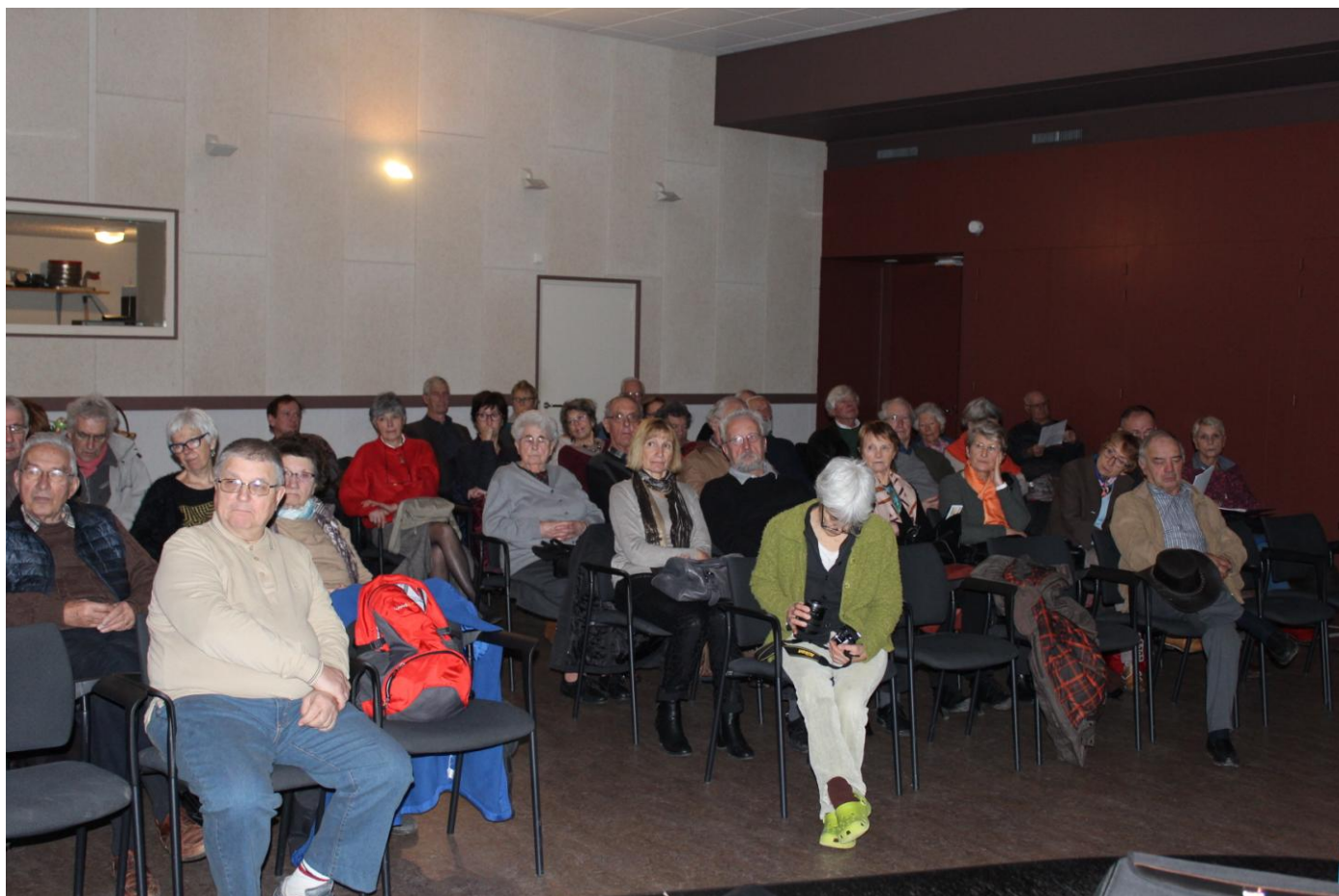
Une assistance bien à l'écoute...